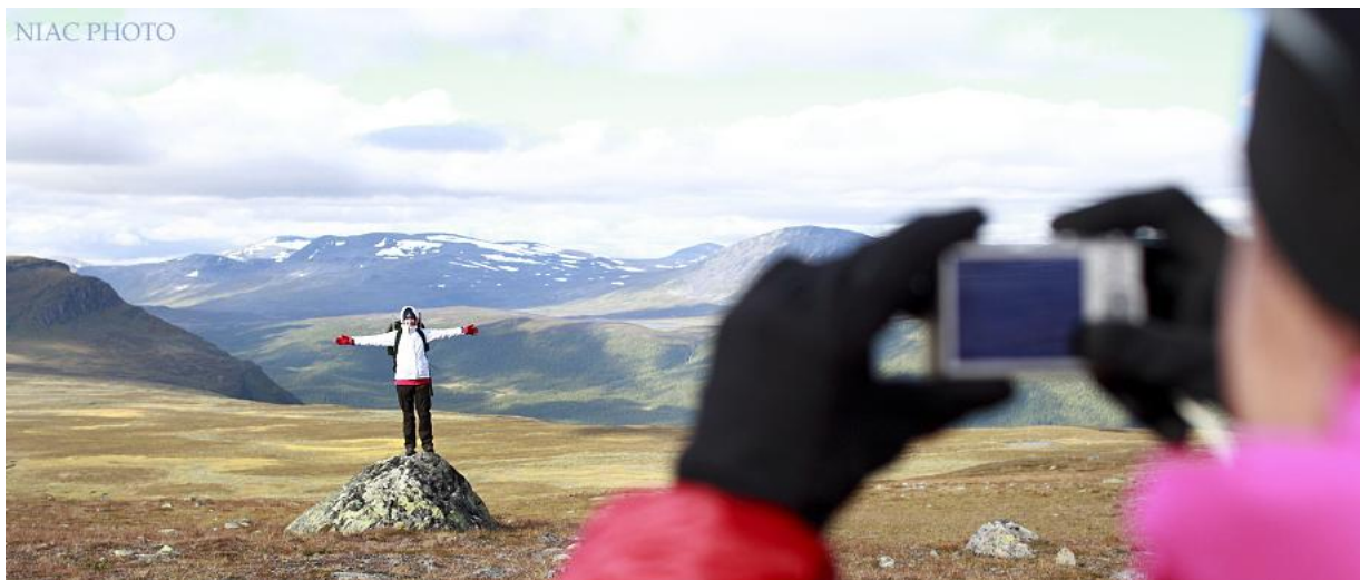
Vidsträckta landskap ger oss energi under Må bra- vandringen

Följ med på en energigivande Må bra-vandring i Vindelfjällen, Europas största naturreservat. Du behöver inte ha fjällvandrat förr, bara ha viljan att uppleva fjällen under njutbara former.